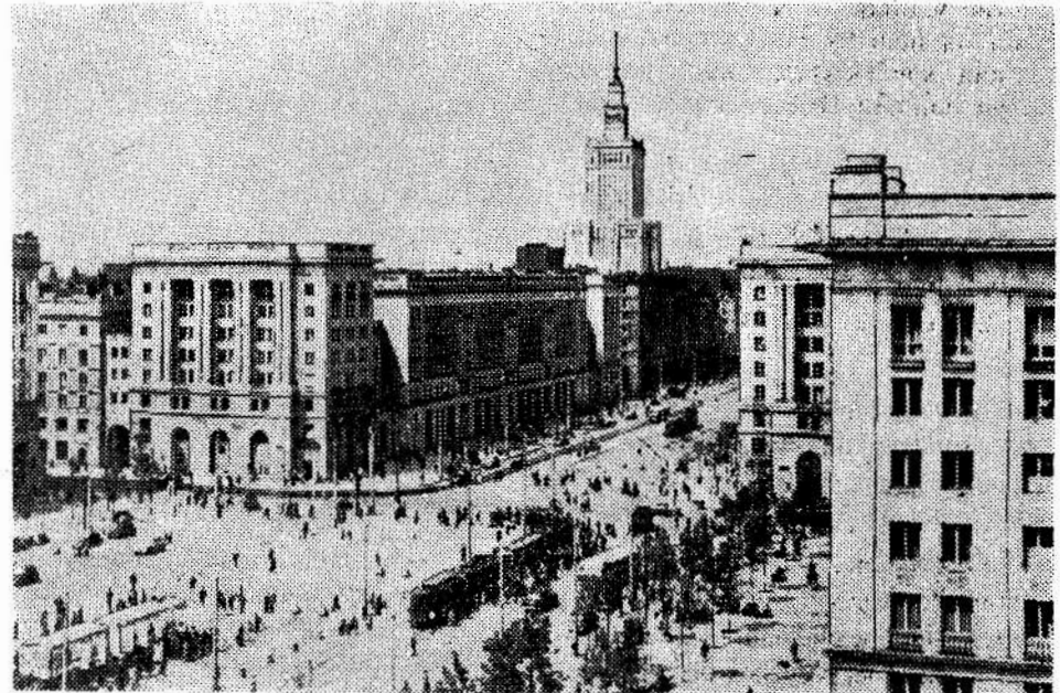
Республика Полшәе Шьмаә'тиә. Мөйдана Конститут'сиәе ль Варшавае.

1 июле һатийә қәдандьне бь 108,6 сәләфа, йә ач'ар бь 122,8 сәләфа.